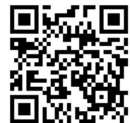
ウェブフォーム QRコード

TEL : 03-3553-4104 / FAX : 03-3553-0139 / E-mail : moni1000satochi@nacsj.or.jp