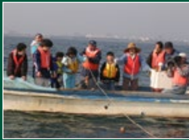
NPO 法人 水辺に遊ぶ会 (大分)