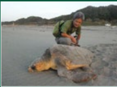
NPO 法人 表浜ネットワーク (愛知)