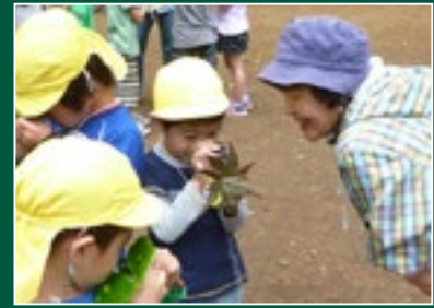
千葉県自然観察指導員協議会 小学校自然観察支援ネットワーク (千葉)