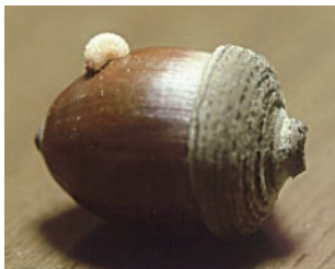
オキナワウラジロガシから出てきたシギゾウムシの幼虫