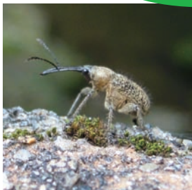
ハイイロチョッキリ