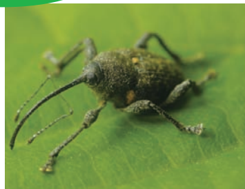
シギゾウムシの仲間

ハイイロチョッキリは、シギゾウムシの仲間(コナラシギゾウムシ、クリシギゾウムシ、クヌギシギゾウムシなど)より先にどんぐりに卵を産んだ後、小枝ごと切り落とすので、シギゾウムシが同じ実には産卵してはなりません。シギゾウムシは産卵した後、どんぐりをそのままにします。枝がついているどんぐりから白い幼虫が出てきたらハイイロチョッキリ、枝がついてなければシギゾウムシの幼虫です。