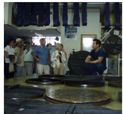
地元の伝統産業「藍染め」のお話を聞く(イメージ)