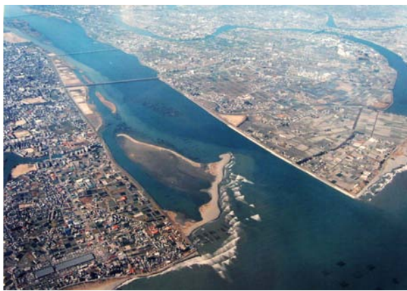
吉野川河口の風景

TEL:03-3553-4103 ikimono@nacsj.or.jp http://www.nacsj.or.jp