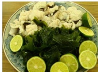
特産スダチと湯引きしたハモ