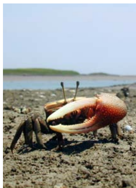
シオマネキ