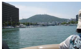
眉山(びざん)を背に舟で市内を移動