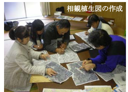
相観植生図の作成